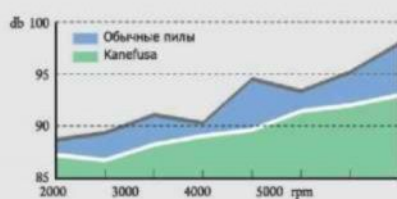
Сравнение уровня шума между обычными пилами и Kanefusa Bord Pro